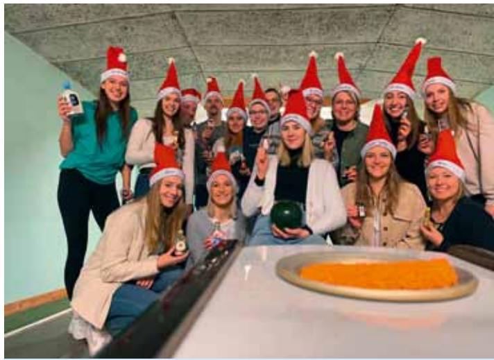
Ein Punkt gewonnen oder einen verloren? Unsere 1. Damenmannschaft gehört auf jeden Fall zur Spitzengruppe der Landesliga und freut sich auf die Weihnachtspause.

Nach dem letzten 33:24-Heimsieg gegen VFL Horneburg reisten wir im Dezember für unser letztes Spiel zum Tabellennachbar, dem Elsflether TB. Bislang waren wir punktgleich - es war also ein Kampf um den zweiten Tabellenplatz. Es würde also nicht einfach werden und einen klaren Favoriten gab es für dieses Spiel nicht.. Die Begegnung! startete recht ausgeglichen, wie auch nicht anders erwartet. In der Abwehr hatten wir noch kleine Probleme und vorne Wurfpech. Bis kurz vor der Halbzeit wechselte der Spielstand immer vom Unentschieden hin zu einem ein- bis zwei-Torevorsprung für uns. Erst kurz vor der Halbzeitpause gelang es uns, mit 14:17 einen Drei-Tore-Vorsprung heraus zu holen.. Wir spielten bis dahin eigentlich eine ganz gute Partie und wollten die Führung nicht mehr aus der Hand geben. So starteten wir auch mit dem