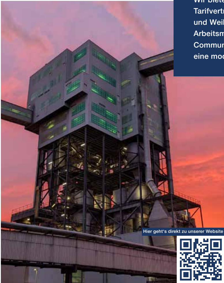
Hier geht's direkt zu unserer Website

Du bist neugierig, motiviert und auf der Suche nach einem Ausbildungsplatz in einem spannenden Arbeitsumfeld? Dann bist Du bei UNS genau richtig!