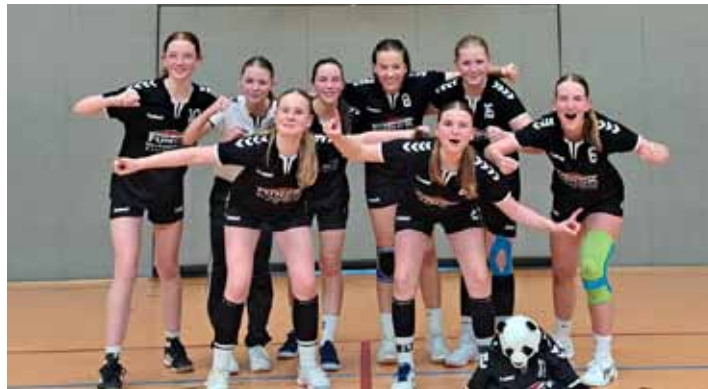
Ehrung für die weibliche Jugend C der HSG BüDrö